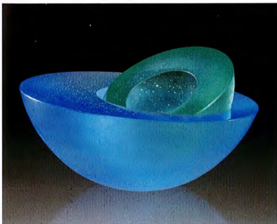
Heike Brachlow: Off Centre, 2004, cast glass, d 19 x h 10 cm, photo: Simon Brunnell

With just a few centimeters of thickness these cast works appear very dark. One of the main objectives of Brachlow's graduate work was to develop a process in which smaller amounts of clearly defined hues in various lighter values can be produced in kilns. She published her results so that other artists have access to them. The second focus of her graduate work was to develop a new group of works. This she created by selecting cubes of test colors, which Brachlow newly arranged in rows of hues and stacked in towers. Looking through the cubes, the overlapping effects lead to ever new mixtures of colors. These "ready-made" works of this Theme and Variation series consists of