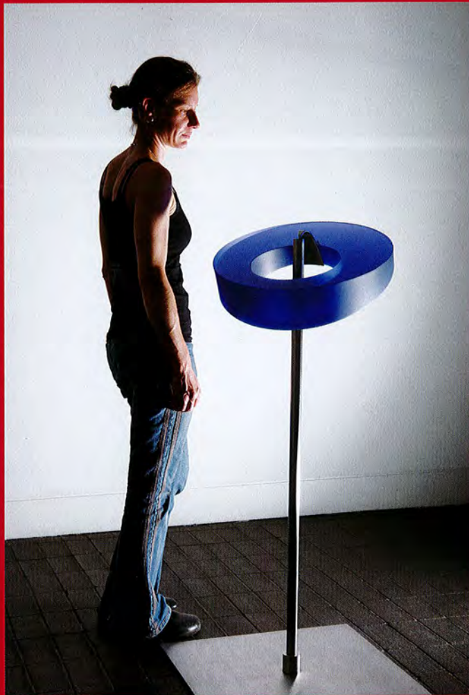
Heike Brachlow: Avis III, Six Impossible Things Series, 2011, cast glass, steel, stainless steel, d 48 cm, photo: Ester Segarra

Reisen führten Brachlow durch die ganze Welt. In Neuseeland lernte sie im Jahr 2000 eine Studioglaswerkstatt kennen. Von der Ausstrahlung transparenter Glasfarben im durchscheinenden Licht war sie fasziniert und begann, das Glasblasen zu erlernen. Die Suche nach einer Hochschule endete in England. An der University of Wolverhampton befasste sie sich zunächst mit dem Glasblasen, entdeckte aber auch die Arbeit mit Formschmelztechniken, die ihren Interessen an geometrischen Formen und scharfen Kanten viel mehr entsprachen. Aus dieser Zeit stammen dickwandige Schalen, mal geblasen, mal formgeschmolzen und bisweilen ineinandergestellt. Diese Schalen eröffneten Brachlow zwei neue, grundlegende Perspektiven für das weitere Werk: Die subtilen Übergänge von Farbnuancen eines einzigen Farbtons bei formgeschmolzenem Glas entsprechend variierender Wandstärken von Lichthell bis fast ins