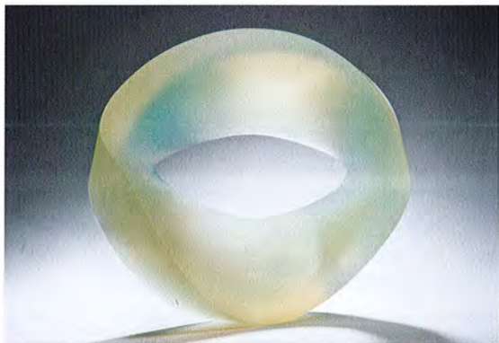
Heike Brachlow: Allusion, 2016, cast glass, photo: Ester Segarra

The sculptures of Heike Brachlow appear to be solid and weightless at the same time. She has expanded the vocabulary of cast glass with her work and developed an outstanding independent language of forms in a continually more focused area of work. In the catalog of the exhibition Chaos Theory of 2016, she explains