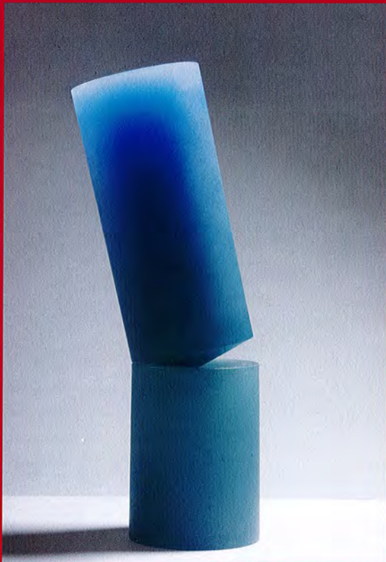
Heike Brachlow: Waiting V, 2008, cast glass, 2 elements, h 65 x w 17,5 x d 17,5 cm, 2 variations