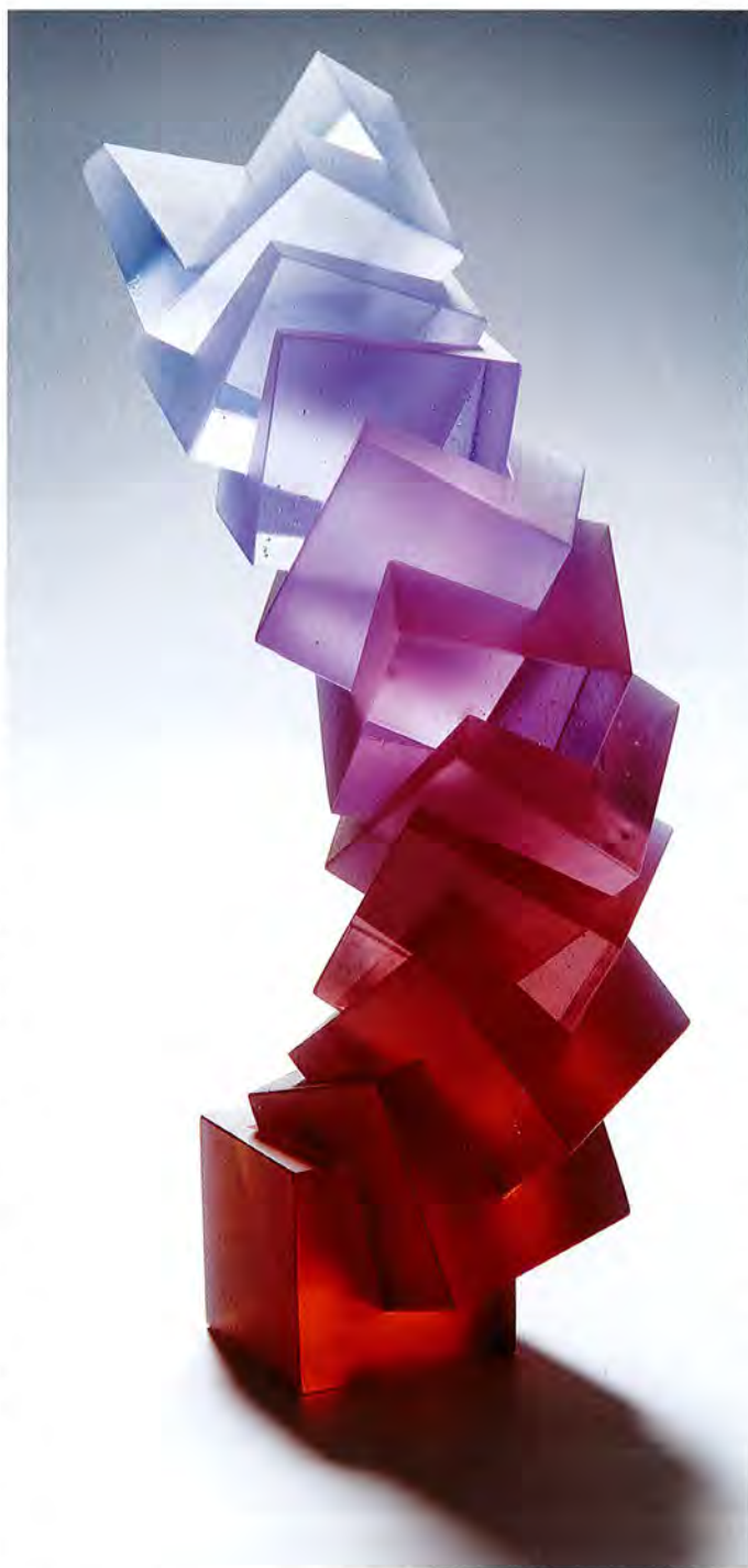
Heike Brachlow: Theme and Variations I, 2009, polychromatic cast glass, each cube: 6x6x6 cm, the individual cubes are coloured with the same mixture of oxides, using increasing amounts; the glass contains neodymium oxide, which causes it to change colour in different types of light, most obviously between incandescent (pink) and fluorescent light (green)

B ewegung und Transformation sind die zentralen Begriffe zur Erschließung des Werks von Heike Brachlow. Weitere sind: Farbe, die Schönheit geometrischer Grundformen und ihrer Ableitungen sowie ein spielerischer Zugang, der die Betrachter zu Akteuren macht. Es geht um den Übergang von einem Zustand zu einem anderen. Klare, transparente Farben verändern mit der Wandstärke der formgeschmolzenen Arbeiten ihren Farbton. Polychromatisch gefärbtes Glas wechselt bei der Nutzung verschiedener Lichtquellen völlig seine Farbe, als hätte man unterschiedliche Objekte vor sich. Viele von Brachlows Arbeiten können durch die Betrachter in Bewegung versetzt werden: Sie pendeln hin und her, sie schwingen vor und zurück, drehen sich um die eigene Achse, dass einem Angst und Bange wird um die physische Integrität der anscheinend kurz vor dem Absturz oder Zusammenprall befindlichen Kunstwerke. Oft kommen sie in einer anderen Position zur Ruhe, als der, aus der sie aktiviert wurden. Bauelemente können zu Farbreihen oder Türmen angeordnet werden: Bei den wechselnden Zusammenstellungen entstehen immer wieder neue Überlappungen der einzelnen Farben und damit in der Durchsicht neue Farbmischungen. So wie die Rolle des üblicherweise passiven Betrachters in einen Akteur überführt ist, um die ganze Vielschichtigkeit der Arbeiten erlebbar werden zu lassen, ist auch Brachlows eigene Rolle mehrschichtig. Sie