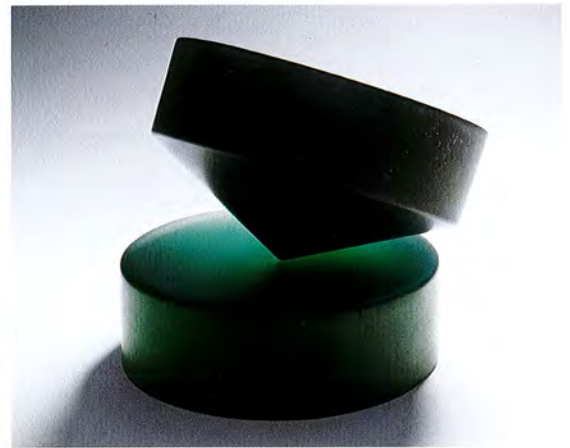
Heike Brachlow: On Reflection III, 2009, cast glass, d 29 x h 29 cm, photo: Ester Segarra